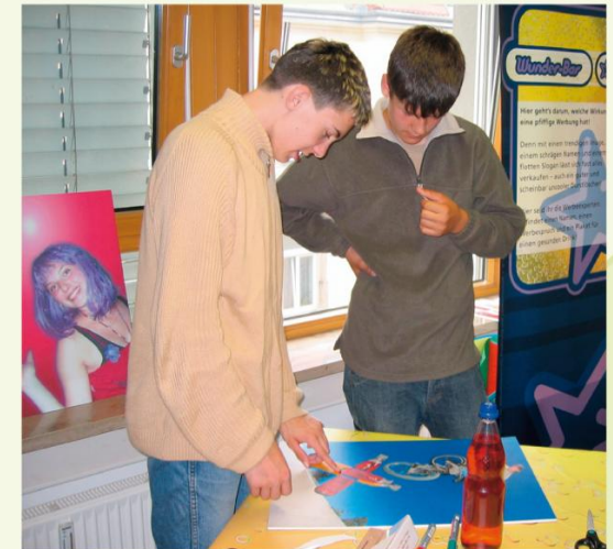
Trendgetränke was ist drin, was ist dran? Schüler gestalten an der „Wunderbar“ ein Werbeplakat für ihr selbst gemischtes Getränk