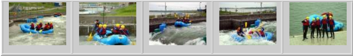
Fotos von den Schulmeisterschaften: