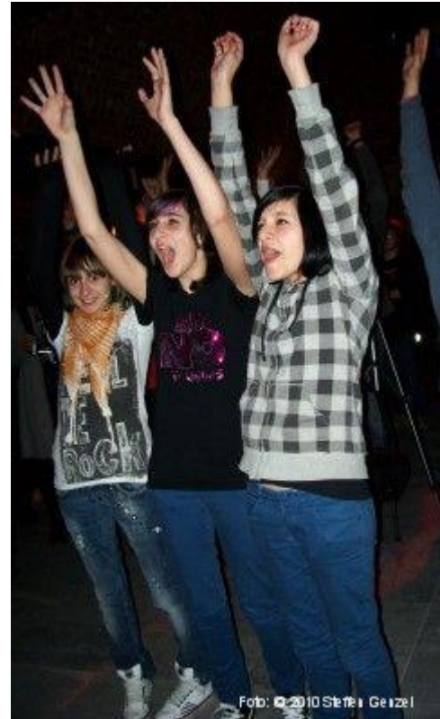
Stimmung pur! Unsere Fans...

Erster Bandauftritt (als DYING ROMANCE) war zum Tag der offenen Tür an unserer Schule am 27. Februar.