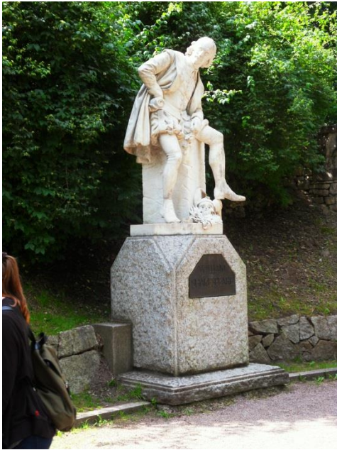
Shakespeare Denkmal Weimar